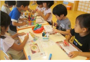
お楽しみ会の準備