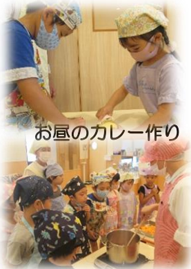
お昼のカレー作り