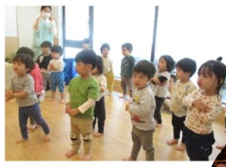
幼児さん リズム運動