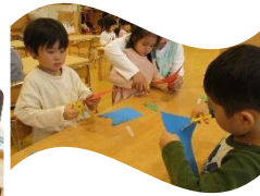
4歳児さん 折り紙・ はさみを使って製作 5歳児さん なわとび・製作