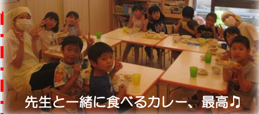
先生と一緒に食べるカレー、最高♪